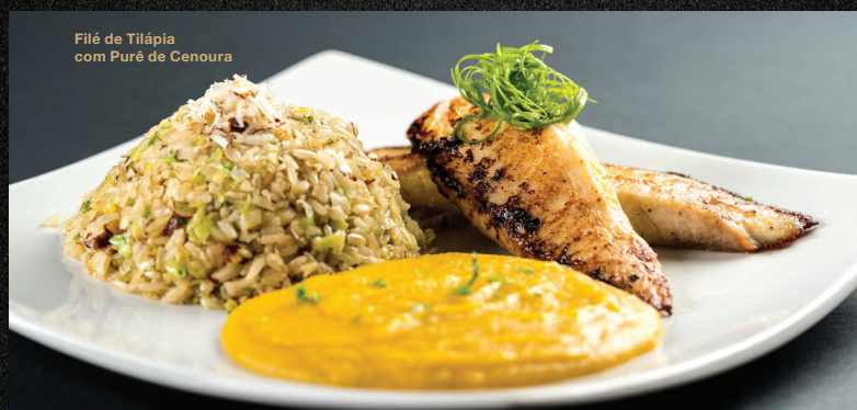
Filé de Tilápia com Purê de Cenoura