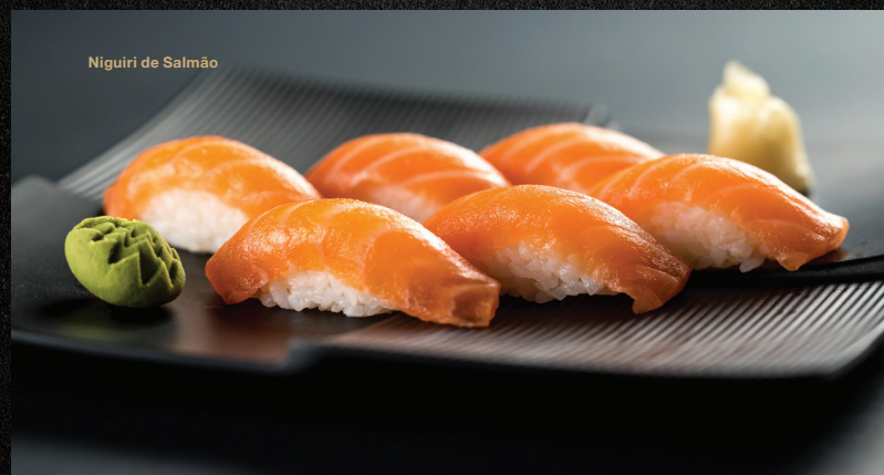
Niguri de Salmão