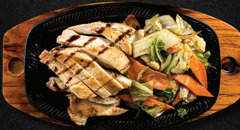
Teppan de Frango