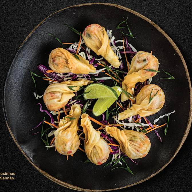
Trouxinhas de Salmão