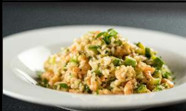
Risoto de Camarão com Abobrinha