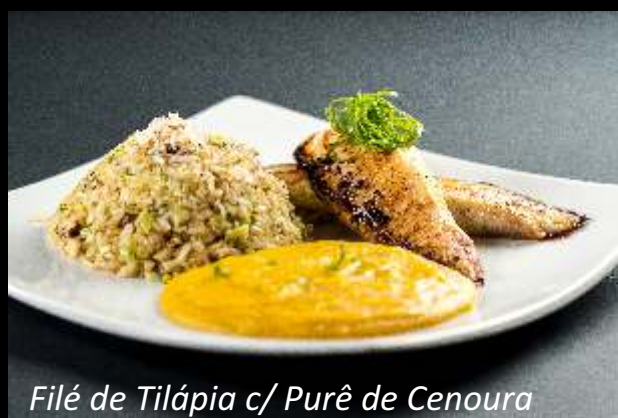
Filé de Tilápia c/ Purê de Cenoura