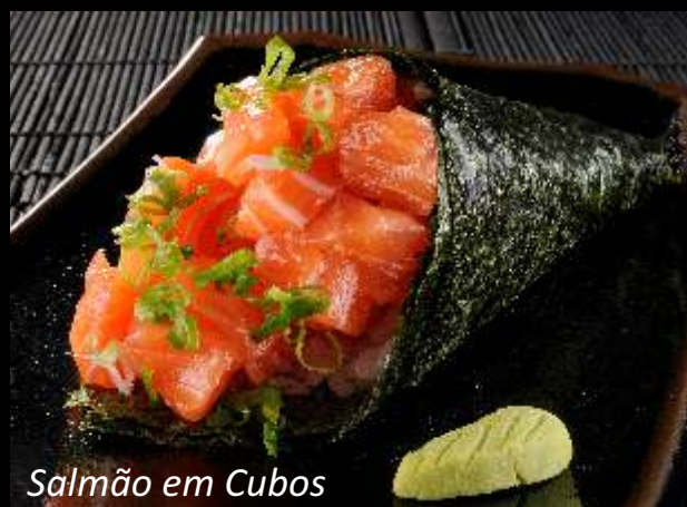
Salmão em Cubos