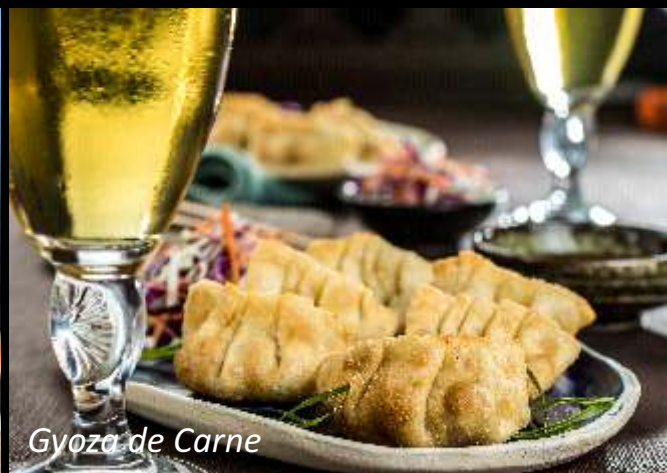
Gyoza de Carne