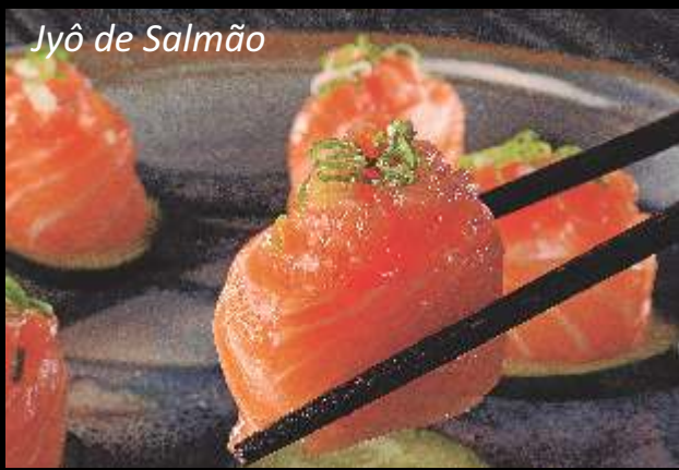
Jyô de Salmão