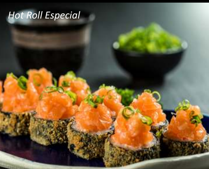
Hot Roll Especial