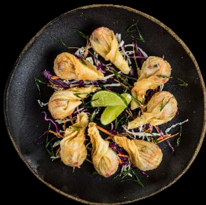
Trouxinhas de Salmão