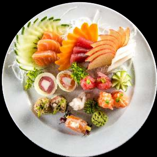
Combinado Nahoe FIT p/ 1 Pessoa