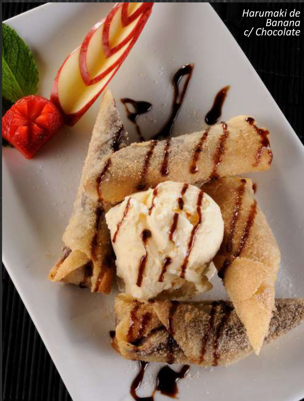
Harumaki de Banana c/ Chocolate